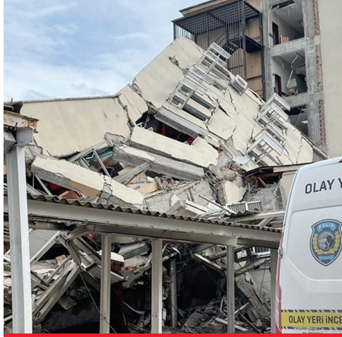
İskenderun Devlet Hastanesi depremde çöktü.

Yirmi yıldır ülkeyi inşaata boğup deprem konusunda kılını kıpırdatmayan AKP döneminde depremde ölü sayısı 50 bini geçti. “Asrın Felaketi” diyerek sorumluluğu üzerlerinden atmaya çalışıyorlar. Oysa gördük; depremde AFAD çöktü, Kızılay çöktü, yeni yapılan hastaneler bile çöktü. Aslında devlet çöktü, sağlık sistemi çöktü.